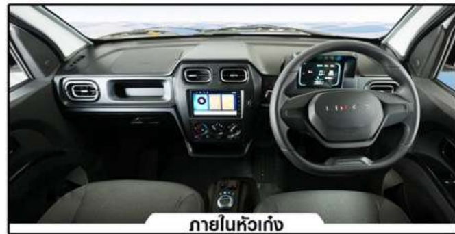
ภายในห้องกึ่ง