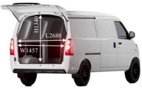
บรรทุกได้ 1 ตัน หรือ 5 ตัน