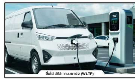
วิ่งได้ 252 กม./ชาร์จ (WLTP)